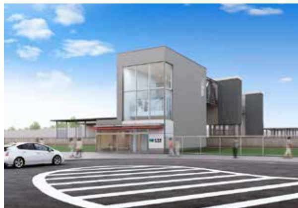
呉羽駅北口完成イメージ図

※北口改札の供用開始に伴い、既設こ線橋および2・3番ホームの待合室は利用できなくなります。また、2・3番ホームの列車停止位置を富山方面側に移動します。