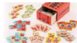
くすりの富山と産業1・2