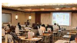
全国各地と富山のくすりとの関係