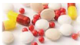
くすりについて1・2