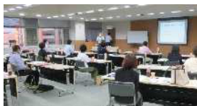
くすりの語り部について くすりのまち富山の概要