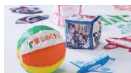
富山売薬について2