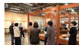
富山市売薬資料館での実習

※ 養成講座の修了後は、ステップアップを目指せる 実践講座①(全5回)、実践講座②(全5回)を受講できます