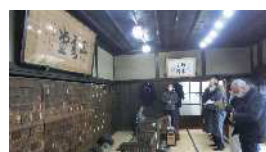
薬種商の館 金岡邸での実習