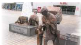
富山売薬について1