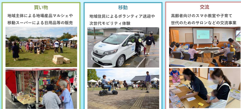
身近な拠点づくり 活動イメージ

地区センター等の公共施設を活用し、地域住民等が主体となって買物支援、ボランティア輸送等による移動支援、地域の交流促進その他日常生活に必要な機能の確保を複合的に実施する活動。