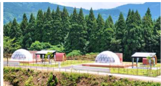
<大自然のテーマパーク 天湖森>