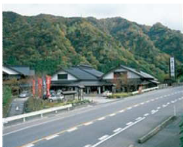
<温泉施設 楽今日館>