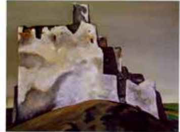
萩中幸雄《大地の黙示録-区》