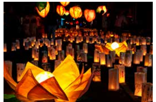
灯籠は、一つ一つ想いを込めて作られています

地元の高校生とわけしょ(若者)が中心となり準備しました。一夜限りで出現する“地上の天の川”をぜひご覧ください。