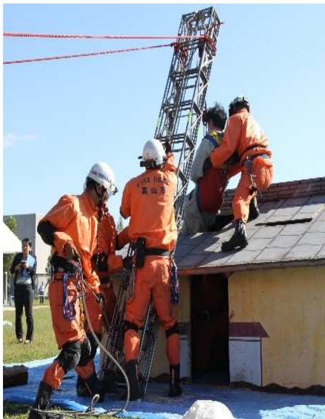
倒壊建物救助訓練