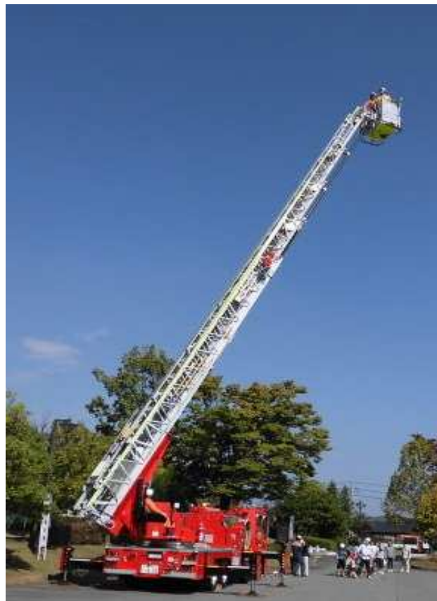
はしご車試乗体験