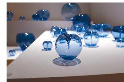
《浮かぶ水の中の渦》 制作：大治将典、富山ガラス工房