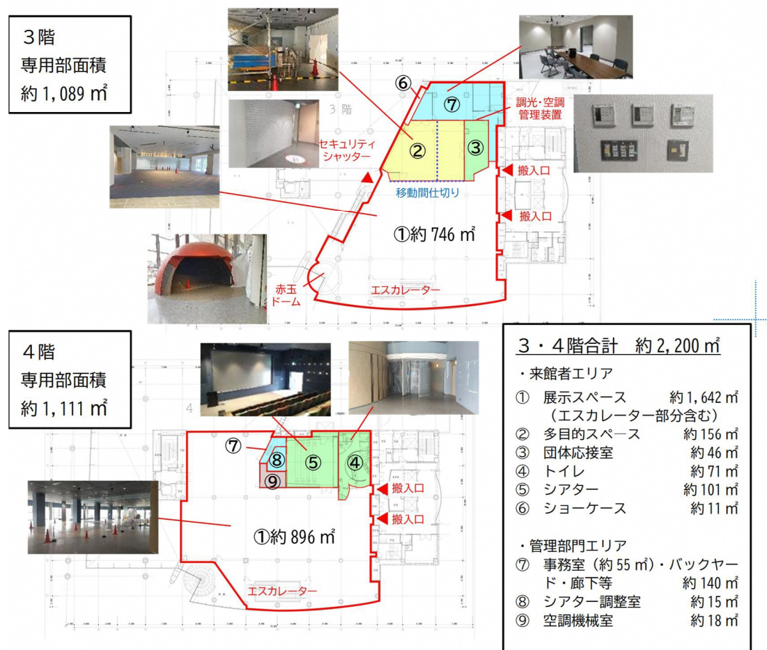
図 1-1 事業対象フロア・専用部の概要