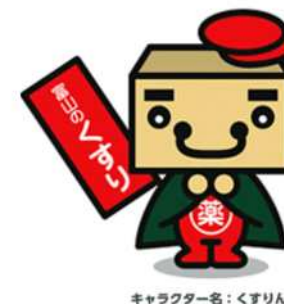
キャラクター名：くすりん