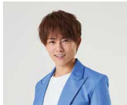
ゲスト すぎうら たいよう 杉浦太陽 つじのぞみ さん