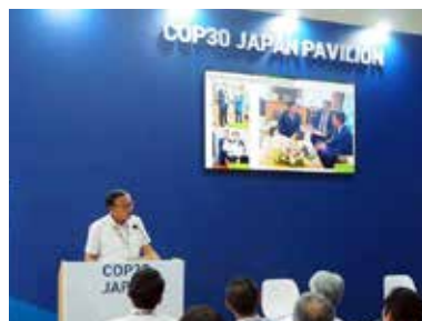
COP30にて市の政策発表

3泊7日のブラジル出張を終えて思うのは、地球温暖化に限らずグローバルな視点での環境問題を解決するためには、未来を担う子どもや若者たちへの環境教育が最も大切だということである。