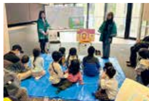
▲親子で防災を学ぼう!