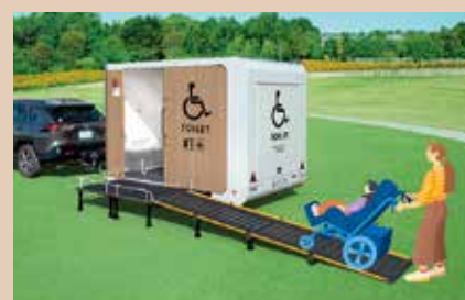
移動型バリアフリートイレ

水を使わず、排泄物を1回ごとにフィルムで密封し、臭いや感染症の二次感染を防ぎます。マンホールトイレの設置がない第1次避難所に設置しました。