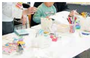
◀バナナペーパー ワークショップ