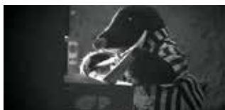
▲ PRISONER/グランプリ (2023)