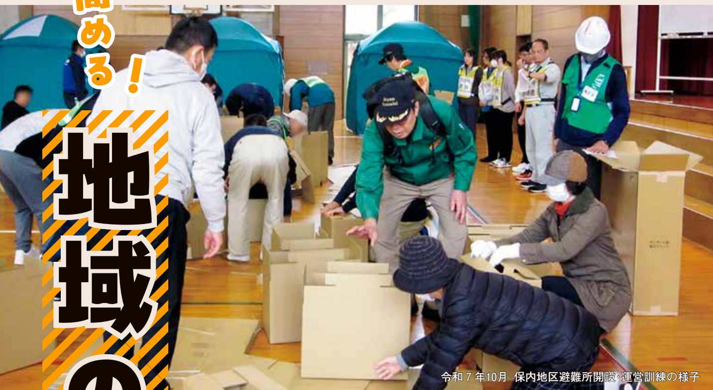
令和7年10月 保内地区避難所開設・運営訓練の様子