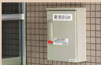
震度感知式・ダイヤル式キーボックス

第1次避難所の鍵が格納されています。震度5弱以上の揺れの感知や、暗証番号入力で解錠されます。速やかな避難所開設を実現するため設置しました。