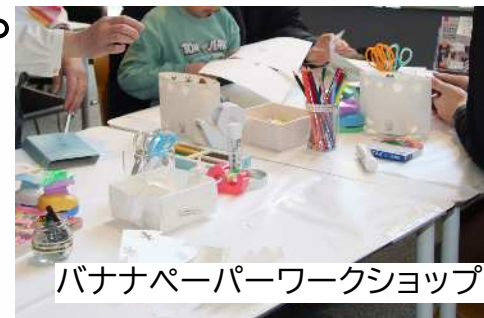
バナナペーパーワークショップ