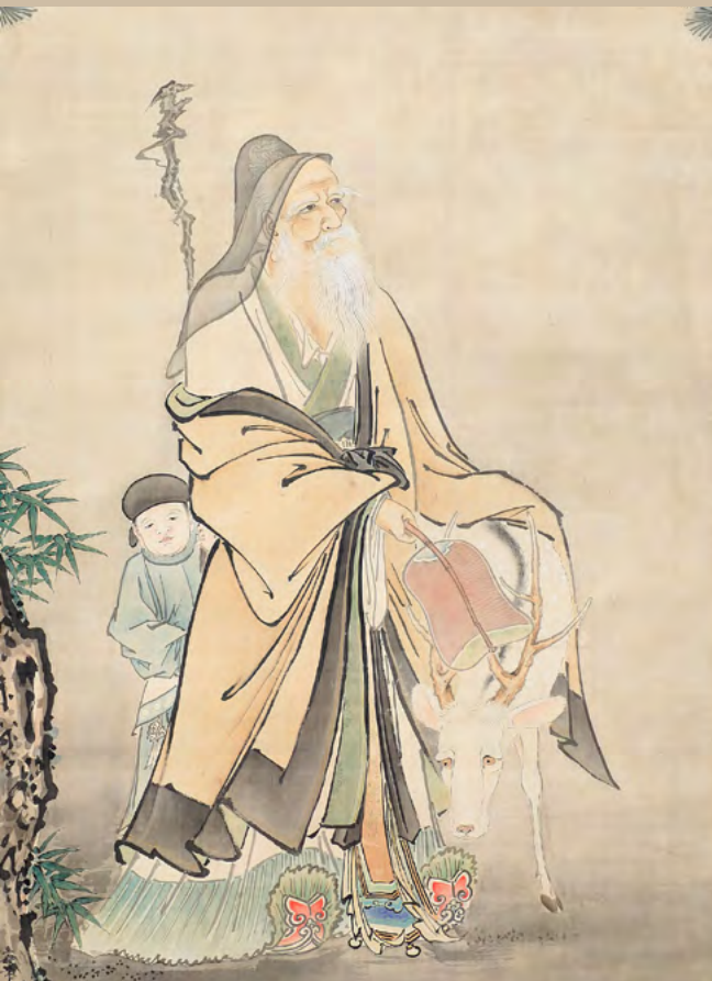
木村立嶽「福祿寿図(部分)」 明治時代 富山市郷土博物館蔵