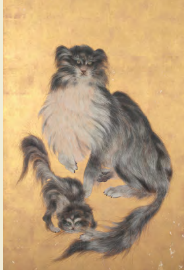
岸駒「雲猫図(部分)」 江戸時代 富山市郷土博物館蔵

開館時間：9:00～17:00（入館は16:30まで）※5/25～5/31 休館