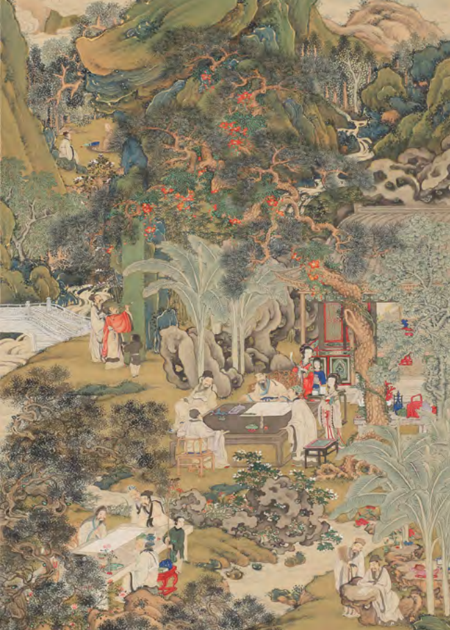
吉田公均「金碧西園雅集図(部分)」 天保11年(1840) 富山市郷土博物館蔵