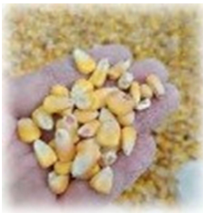
飼料用トウモロコシ

イ 交付額 令和7年10月～令和8年2月に購入された対象飼料 1tにつき400円(県の1/2)を助成