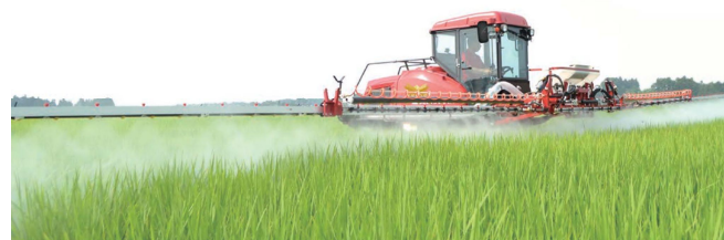
ブームスプレーヤー作業風景